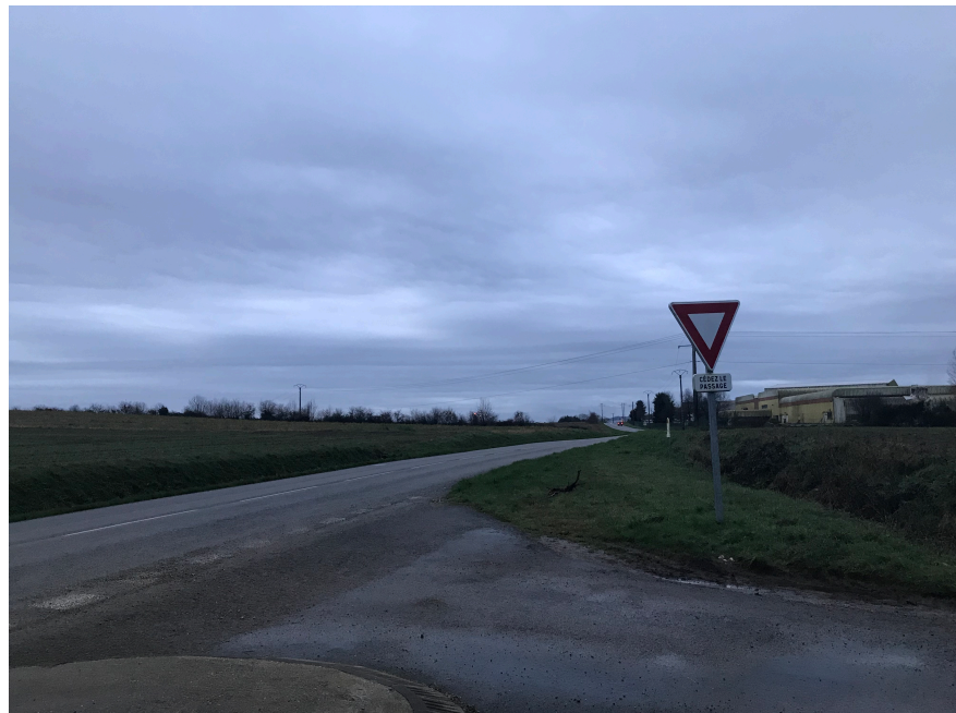
prise de vue en sortant du village de Lopars le 3 02 2020