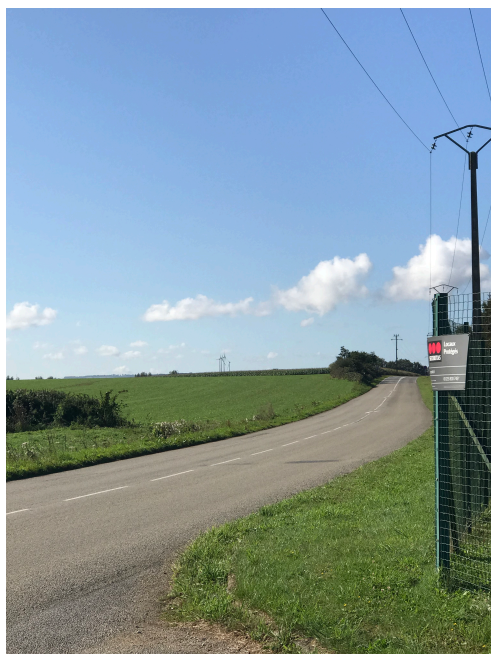
vue aux abords du site le 3 09 2019

Lors de ce dernier déplacement ( vers 8H30° j'ai a pu me rendre compte du trafic matinal aux abords du site sur la route départementale n° 48.